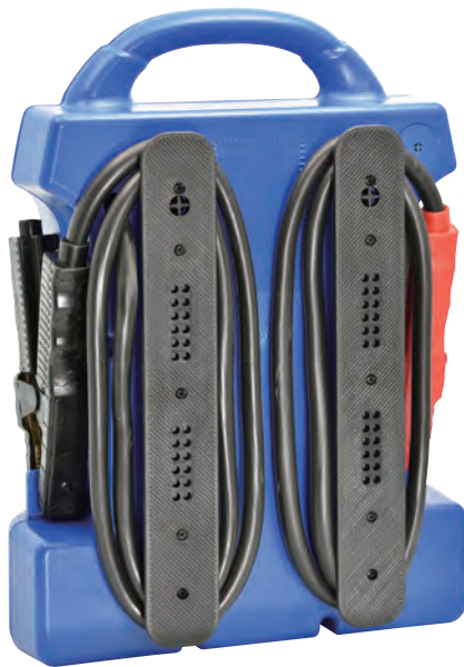
背面ケーブル収納部